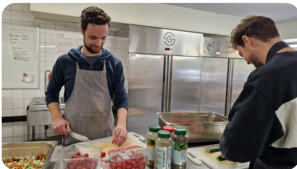
Keukenpersoneel van de Gaarkeuken

Met een aantal voedselbanken en een keten van sociale wijkrestaurants in Zuid-Holland leveren we over en weer voedsel om het aanbod van reststromen beter te laten aansluiten bij de behoefte die we allemaal hebben. Daardoor kunnen we grote reststromen optimaal benutten en kunnen voedselbanken bijvoorbeeld grootverpakkingen die niet geschikt zijn voor consumenten toch een goede bestemming geven bij de sociale wijkrestaurants.